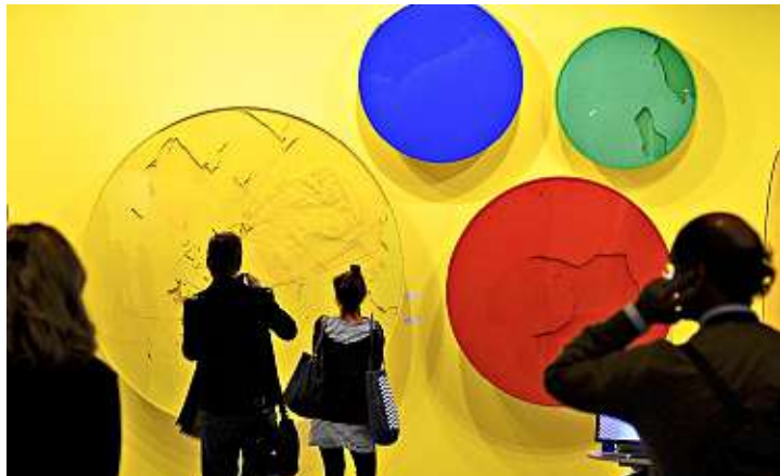
La feria española tuvo este año menos de 100 mil visitantes.

Cortés afirmó que el balance de la edición fue muy positivo, ya que la mayoría de galeristas, 219 procedentes de 23 países, expresaron su satisfacción con